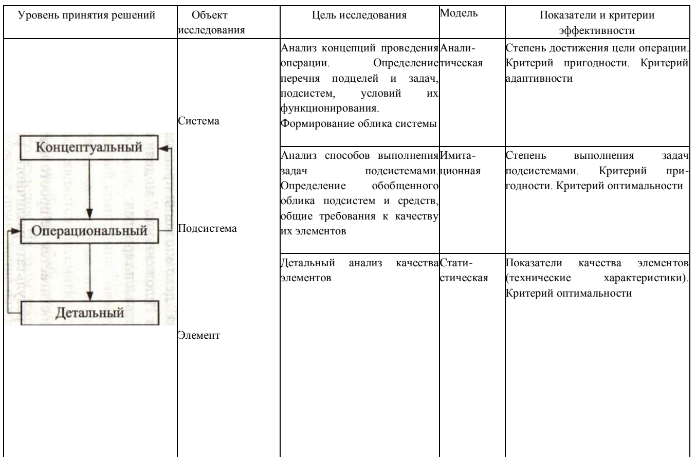
Рисунок 2 - Иерархия уровней принятия решений

Такая трехуровневая декомпозиция общей задачи принятия решений позволяет установить жизнеспособность выдвинутой концепции эффективности системы, порождает системный подход к процессу принятия решений как с точки зрения цели, так и с учетом возможных других подсистем и средств.