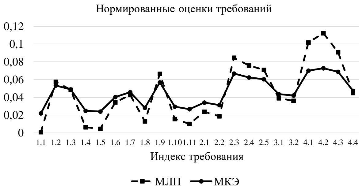
Рисунок 3. Оценки важности требований, полученные по методам МЛП и МКЭ

Как видно из рисунка 3, полученные оценки требований хорошо согласуются друг с другом. Коэффициент корреляции Пирсона [8] оказался равным 0,992. Кроме того, ранжирование требований по важности, как видно из таблиц 3 и 6, полностью совпадает. Это подтверждает то, что оба метода обработки экспертной информации дают адекватные оценки и дополняют друг друга.