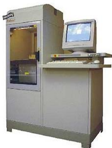
Установка Viper Si2™ SLA®

В Ресурсных центрах института, созданных для подготовки кадров авиационной, ракетной и космической отраслей и других высокотехнологичных оборонных секторов экономики Российской Федерации на основе интеграции науки, образования и производства для поддержания паритетности и создания технологического превосходства в данных отраслях на мировом уровне размещено следующее оборудование предназначенное для быстрого прототипирования.