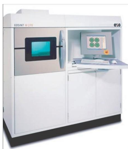
Установка EOSINT M270